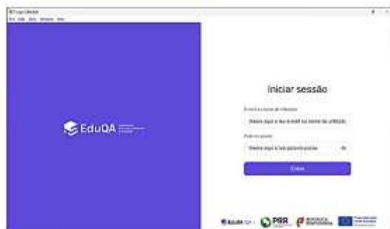
Figura 1 – Acesso à Plataforma de Realização de Provas do EduQA