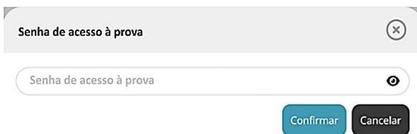
Figura 3 – Pedido da senha de acesso à prova a realizar