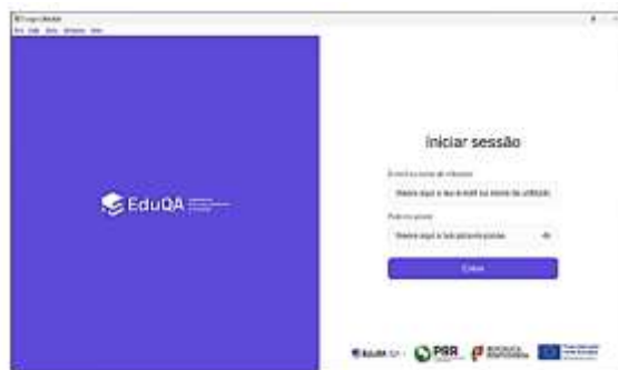
Figura 1 – Acesso à Plataforma de Realização de Provas do EduQA